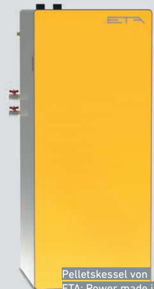
Pelletskessel von ETA: Power made in Oberösterreich