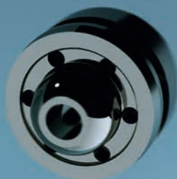
Kleines Teilchen, große Wirkung: einfach in die Armatur schrauben und sparen