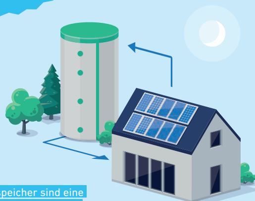
Pufferspeicher sind eine gute Möglichkeit, Strom aus der Photovoltaikanlage in Form von Heizwasser zu speichern.

RAUS AUS ÖL UND GAS Holen Sie sich bis zu 7.500 Euro vom Bund und weitere Förderungen von Land und Gemeinden.