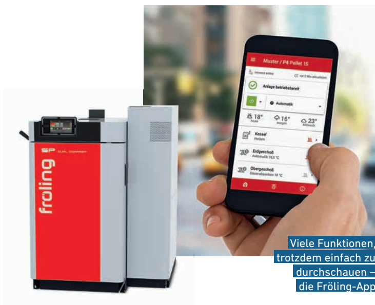
Viele Funktionen, trotzdem einfach zu durchschauen – die Fröling-App