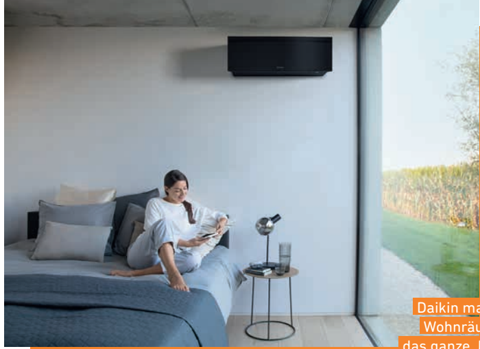
Daikin macht Wohnräume das ganze Jahr über gemütlich.

Sie haben ein gut isoliertes Haus mit wenig Heizleistung? Sie wollen Ihre Gas- oder Ölheizung noch nicht ersetzen, suchen aber nach einer hocheffizienten Zusatzheizung, die auch noch kühlen kann? Es gibt viele Fälle, wo das Heizen mit einer Klimaanlage sinnvoll ist – aber nur, wenn es sich um ein hochwertiges Gerät handelt. Mit dem Qualitätshersteller und Weltmarktführer Daikin sind Sie hier auf der sicheren Seite.