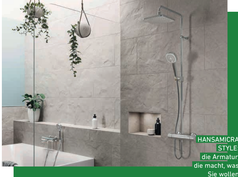
HANSAMICRA STYLE: die Armatur, die macht, was Sie wollen